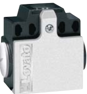
КХ СС... - КХ СМ...